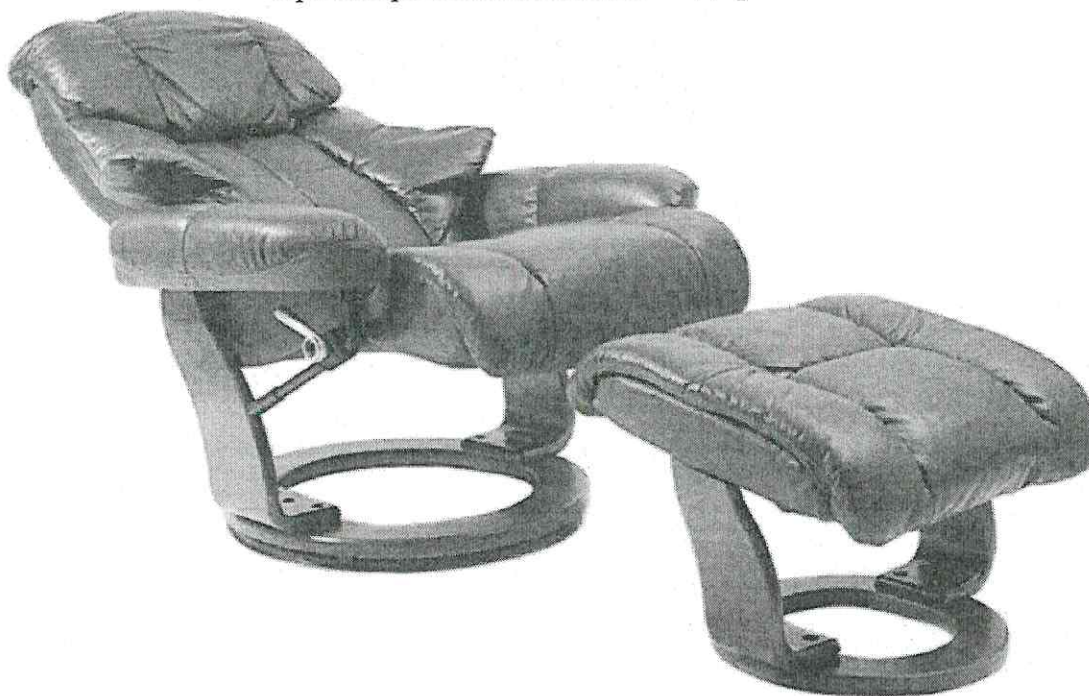
Ориентировочный внешний вид кресла