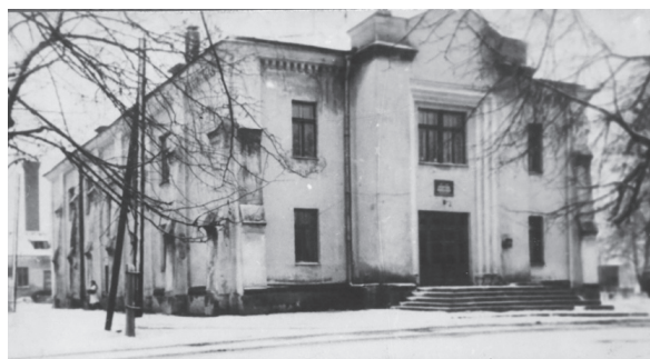
Рис.4. Районная больница (1960 г.)

С открытием хирургического отделения в больнице в районе получила развитие оперативная хирургия, начато проведение плановых оперативных вмешательств (рис. 5). Если в 1950-е гг. в больнице выполнялось за год 60–70 операций, в 1966г. –