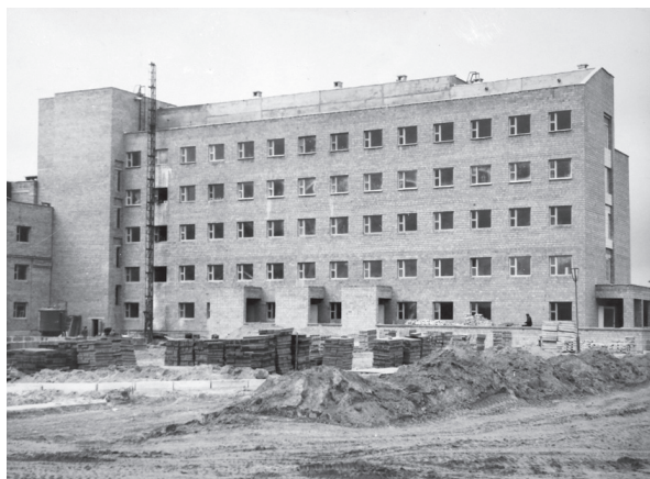
Рис.8. Строительство главного корпуса районной больницы (1984 г.)