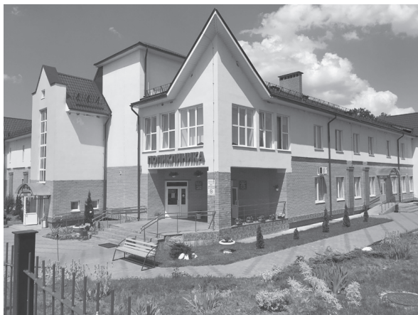
Рис.10. Здание поликлиники после завершения реконструкции (2014 г.)

годаря планомерной работе, практически решен вопрос по укомплектованию учреждения медицинскими кадрами, что позволило значительно улучшить качество оказания медицинской помощи населению. УЗ «Ляховичская ЦРБ» первым в области завершило перевод всех участковых врачей-терапевтов на общеврачебную практику. В 2017–2018 гг. проведен капитальный ремонт пищеблока районной больницы с заменой технологического оборудования. С 2018 г. начаты работы по информатизации здравоохранения района, автоматизированы рабочие места врачей поликлиники и амбулаторий, что позволило перейти на ведение единой электронной медицинской карты пациента и выписку электронных рецептов.