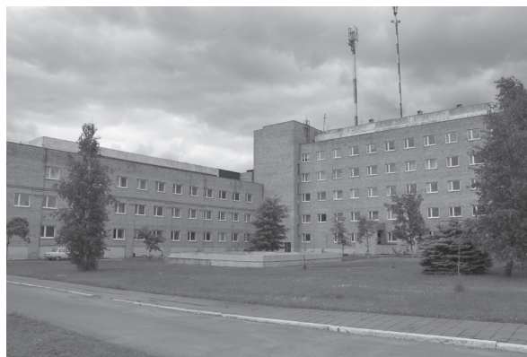
Рис.9. Ляховичская центральная районная больница (2017 г.)