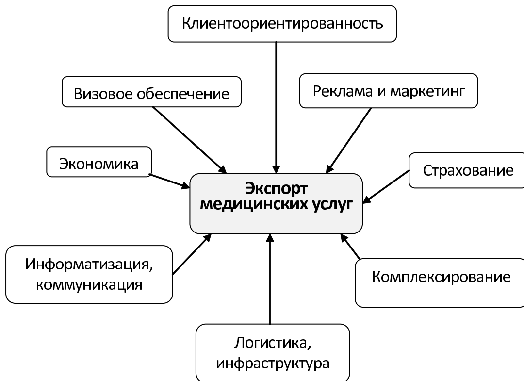
Рис. 1. Составляющие экспорта медицинских услуг [4]

Привлечению медицинских туристов в ту или иную страну во многом способствуют показатели деятельности здравоохранения, выражаемые