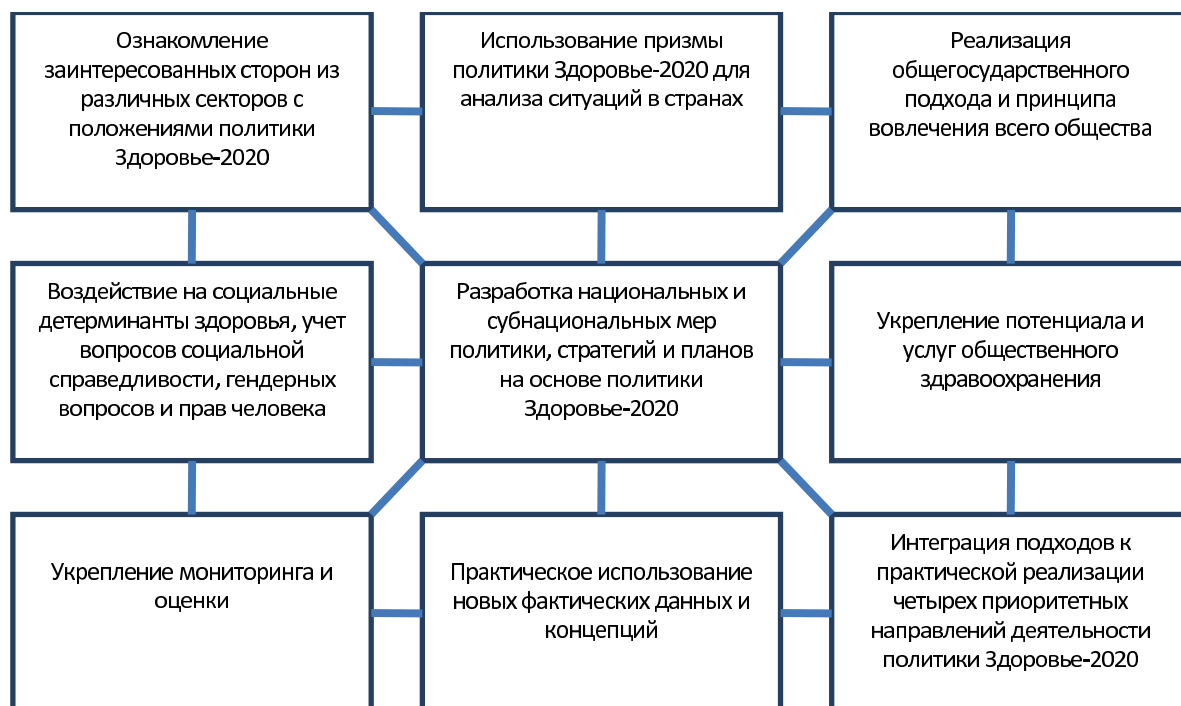
Рис. 2. Девять компонентов пакета политики Здоровье-2020

На первоначальном этапе странам следует разработать национальную политику здравоохранения с соответствующими стратегиями и планами. Опираясь на результаты тщательной оценки потребностей, следует ответить на следующие вопросы: «Каких результатов страна надеется достигнуть в плане улучшения показателей здоровья при соблюдении принципа социальной справедливости?», «Какие многоотраслевые стратегии и программы будут осуществлены, например, в отношении неинфекционных заболеваний?». Набор инструментов и методик политики Здоровье-2020 поможет в поиске оптимальных ответов. В отношении общественного здравоохранения полезным руководством является Европейский план действий по укреплению потенциала и услуг общественного здравоохранения