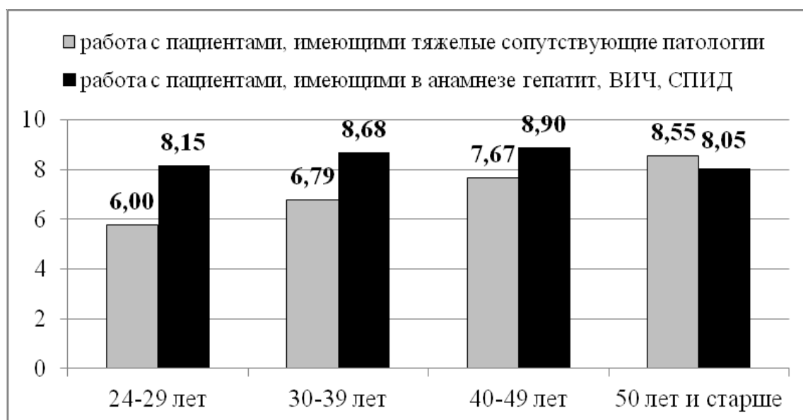
Рис. 3. Уровень профессионального стресса у врачей-стоматологов по третьей группе факторов (состояние общего здоровья пациентов) (балльные оценки)

циентов с тяжелыми сопутствующими патологиями (возрастная группа 24–29 лет – 6,00 баллов; 30–39 лет – 6,79 баллов; 40–49 лет – 7,67 баллов; 50 лет и старше – 8,55 баллов).