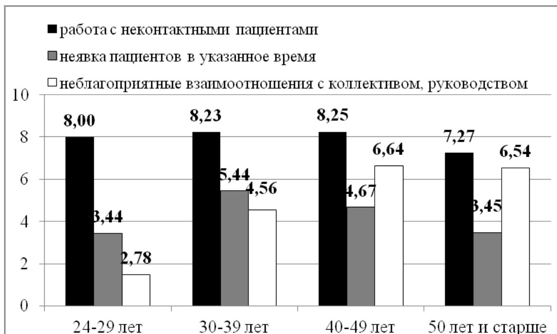
Рис. 2. Уровень профессионального стресса у врачей-стоматологов по второй группе факторов (взаимоотношения с пациентами и в коллективе) (балльные оценки)