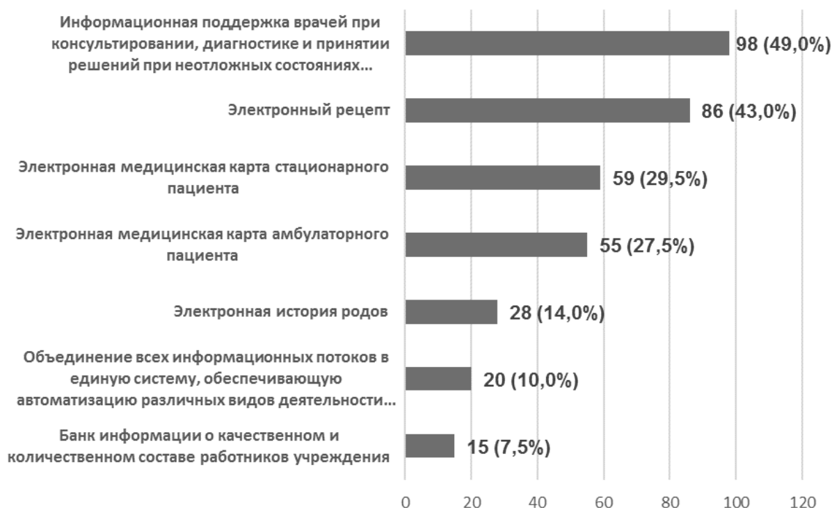
Рис. 3. Внедрение информационных технологий в перинатальных центрах (мнение респондентов)

Результаты исследования показали, что имеется настоятельная необходимость совершенствования материально-технического оснащения перинатальных центров на всех технологических уровнях. Самые низкие баллы были выставлены респондентами по критерию оснащенности медицинским оборудованием. Средняя оценка по данному критерию составила 3,53 [ДИ95% 3,40÷3,66]