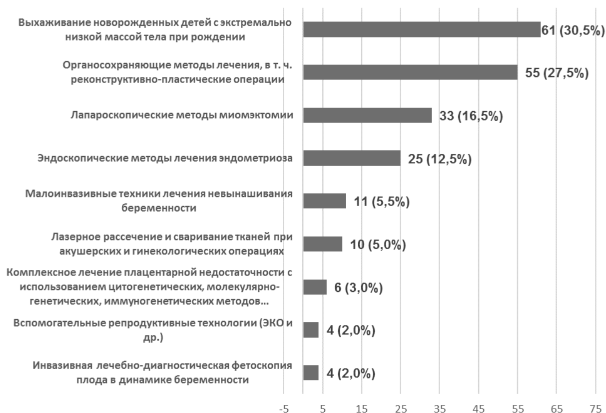
Рис. 1. Внедрение высокотехнологичных методов диагностики и оказания медицинской помощи в перинатальных центрах (мнение респондентов)

Эпидемия COVID-19 с особой остротой подчеркнула важность готовности медицинского персонала перинатальных центров к оказанию медицинской помощи в клинических ситуациях, когда